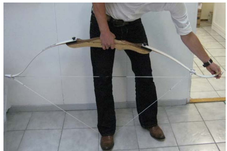
Wanneer de boog genoeg op spanning staat kunt u de pees aan de lat bevestigen