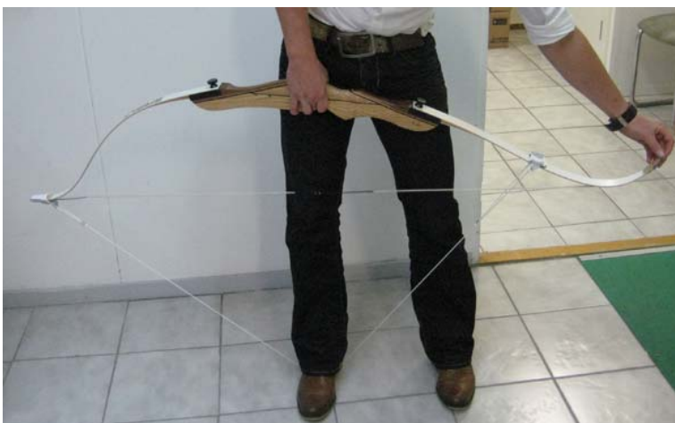
Zet u voet op het koord en trek de boog naar boven