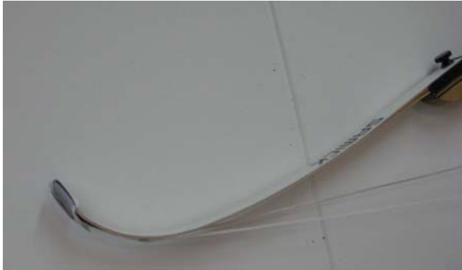
Dichte uiteinde van de boogspanner