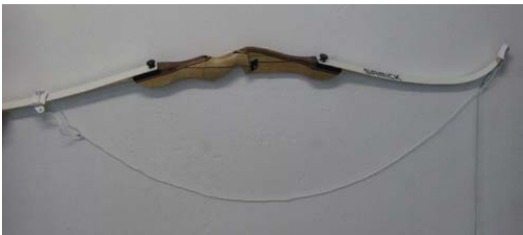
Boog na het bevestigen van de boogspanner