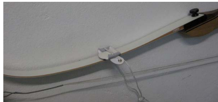
Pees door de lus van de boogspanner